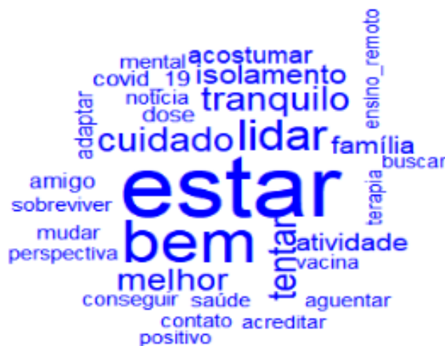
Figura 3 – Nuvem de palavras. Estratégias de enfrentamento/resiliência desenvolvidas pelos discentes de duas instituições de ensino superior na pandemia da Covid-19

Os resultados da nuvem de palavras convergem com a análise de similitude ao exibirem os termos com maior ocorrência, destacados nas comunidades.