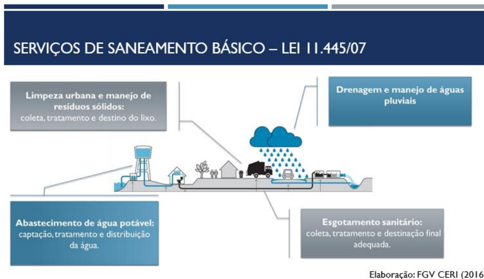
Figura 1 – Pilares do Saneamento

democrático: abastecimento de água potável e esgotamento sanitário no Brasil e na América Latina”, no dia 14 de outubro de 2021, traz os quatro pilares do saneamento básico: