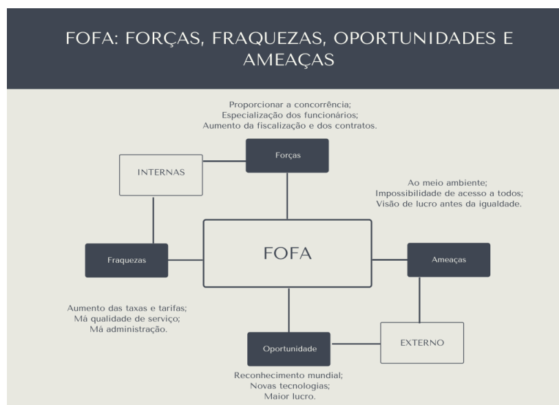
Figura 2 – FOFA

Outrossim, em conformidade FERNANDES (2012) e QUEZADA (2009) deve-se propor criar e desenvolver planos, panoramas e projetos, seja público ou privado, para realização de obras, empreendimentos e atividades realizadas na área do saneamento básico que tenham impacto nas áreas analisadas por este estudo. Assim sendo, por intermédio dessa metodologia é possível desenvolver mecanismos para a gestão, a organização e a sistematização dos dados coletados, por meio de uma abordagem crítica sobre os modelos de privatização adotados por países latinos americanos e europeus, explorando cada um dos componentes da matriz FOFA (Figura 2).