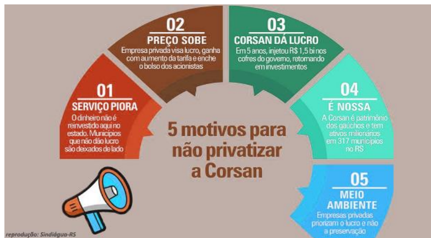
Figura 5 - ONDAS Brasil