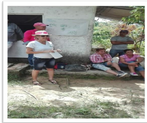
Figura 10: Docente encargada de dirigir el proceso de convivencia con los estudiantes y campesinos en Comunidad Rural.