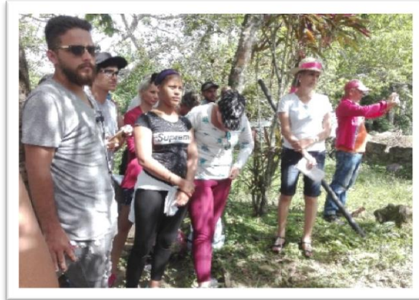
Figura 9: Experiencias expuestas por los estudiantes de la Universidad durante la semana de convivencia en Comunidad Rural.