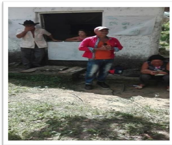
Figura 8: Productor exponiendo sus experiencias y resultados de la convivencia desde su mirada como poblador rural y productor.