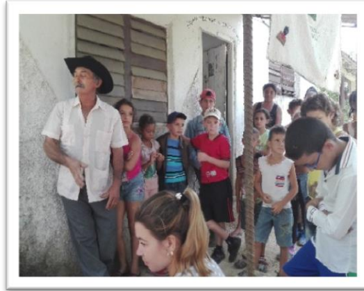
Figura 7: Productor insigne en la Comunidad Rural La Herradura acompañado de pioneros integrantes del Círculo de Interés Ambiental.