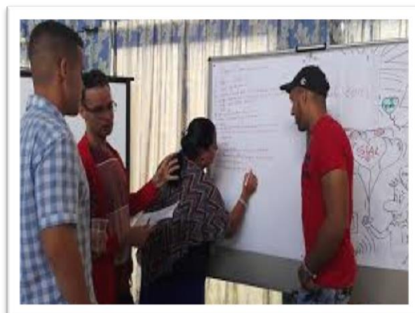
Figura 4: Grupo de formadores y promotores de instituciones educativas en charlas y talleres a productores.

Estas acciones, fueron transformándose en el tiempo a lo que en la actualidad es conocido como Plataformas Multiactorales de Gestión (PMG) ; convirtiéndose en un sistema de relaciones entre los actores locales, dirigido fundamentalmente a promover y desarrollar de manera sostenible, cambios continuos de los sistemas productivos de forma tal que propicie el incremento en cantidad y calidad de los beneficios obtenidos (figuras 4 y 5).