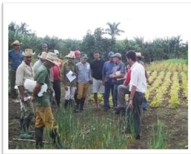
Figura 2: Capacitación en áreas productivas en mejoramiento de semillas a productores de manera participativa.

También se demostró que cuando los agricultores y agricultoras deciden sobre las variedades que se van a cultivar en el ámbito local, los rendimientos, la diversidad y el reconocimiento social de los mismos se elevan significativamente, demostrando de esta manera la significación que alcanza el ser considerado parte del proceso de obtención final del producto desde el inicio, lo cual es conocido sociológicamente como participación social del individuo en el proceso. Las figuras 2 y 3 demuestran fehacientemente lo antes expuesto.