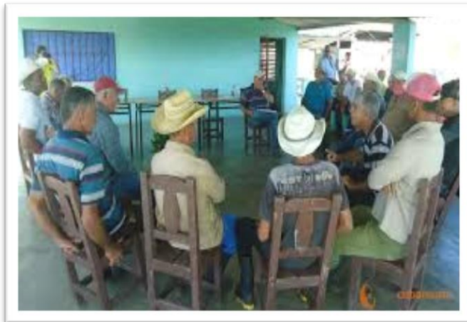
Figura 5: Encuentro practico de promotores agroecológicos con productores implicados en el proyecto.

Por su parte, durante la tercera fase de ejecución, desarrollada la misma en el periodo comprendido del año 2013 al año 2017, se consolida el trabajo en los escenarios ya existentes, dígase sitios de intervención identificados previamente, y mediante incidencia en políticas públicas.