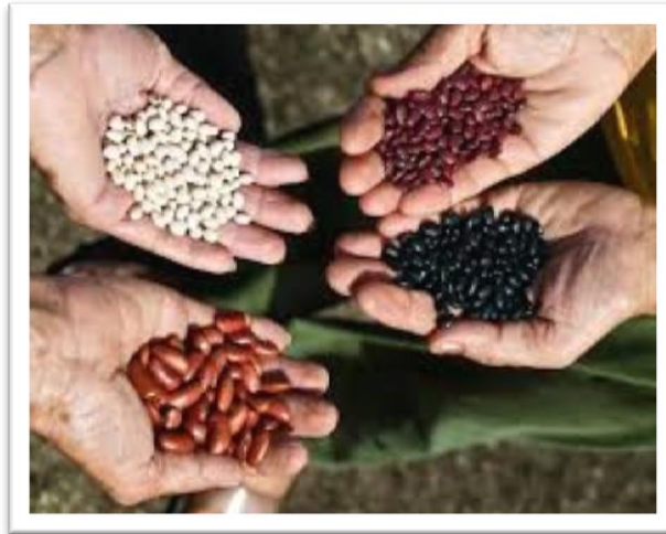
Figura 3: Resultados productivos del mejoramiento de semillas en variedades de granos.

Para la segunda etapa, la cual se enmarca en los años comprendidos desde el 2007 al 2011, el cual implicó diferentes territorios, en los mismos fueron conformados y desarrollaron equipos participativos para involucrar el tejido de actores locales y seguir extendiendo las acciones de trabajo.