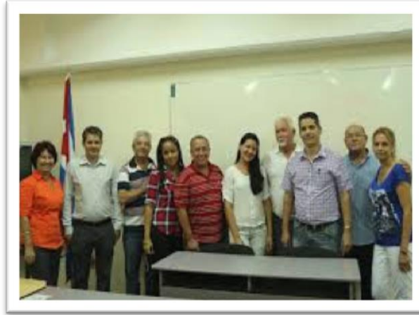
Figura 6: Grupo coordinador implicado en el PIAL en Villa Clara, proveniente de la Universidad Central "Marta Abreu" de Las Villas.

coordinador a los diferentes escenarios de trabajo identificados en el territorio, a partir de identificar potencialidades y deficiencias a resolver (figura 6).